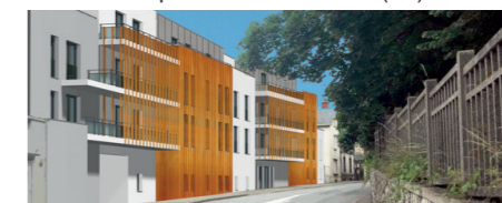
Hôtel Ibis Styles - Dreux (28)