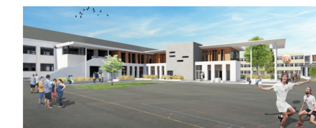
Cité scolaire Émile Zola - Châteaudun (28)