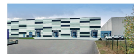
Eurowipes - Nogent-le-Rotrou (28)