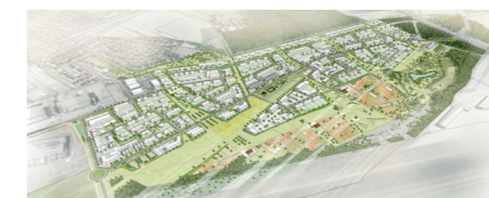
ZAC des Antennes - Champhol (28)