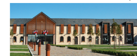
Cœur de village - Mignières (28)