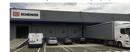
Schenker - Chartres (28)