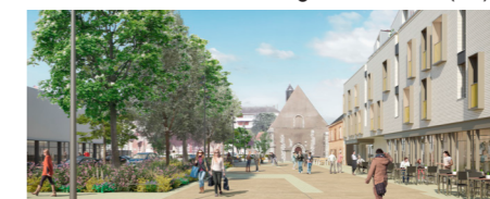
Cœur de ville - Luisant (28)