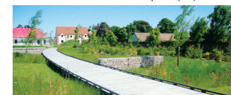
Les Erriaux - Saint-Georges-sur-Eure (28)