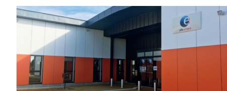
Pôle emploi - Champhol (28)